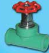
Stop Valve/Gate Valve