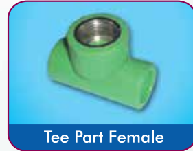
Tee Part Female