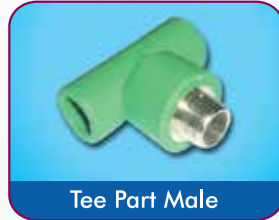
Tee Part Male